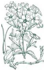
122. Saponaria officinalis L. Saponeurtje; Pfl.-W.

Torretje staat dan ook op, schiet zijn pantoffels aan en hangt zijn muts aan een haakje in de badkamer; veel meer valt er niet uit te kleden: kabouters slapen altijd in hun blootje. Het warme en het koude water worden gemengd en Torretje kan in bad stappen. "Net goed", zegt hij. Uit het zeepbakje neemt hij een handvol zeepkruid*, wrijft het fijn in het water dat overvloedig gaat schuimen. Ondertussen kleedt Muisje zich aan (ze gaat straks wel in bad). Terwijl Torretje zich wast en afdroogt, dekt Muisje de tafel. Torretje maakt het