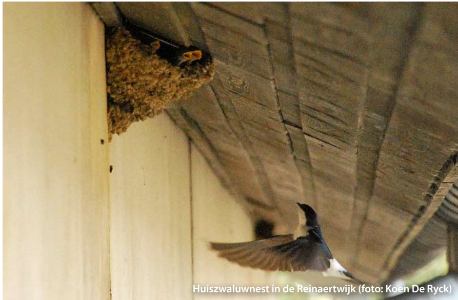
Huiszwaluwnest in de Reinaertwijk

De provincie Vlaams-Brabant deelt Koestersterren uit aan projecten die het best inspelen op de doelstellingen van de campagne Koesterburen , die zeldzame of iconische soorten nieuwe kansen wil geven. Dilbeek viel voor het tweede jaar op rij in de prijzen. Het project 'huiszwaluwen krijgen een sociale woning' ontving de ster voor de beste terreinactie.