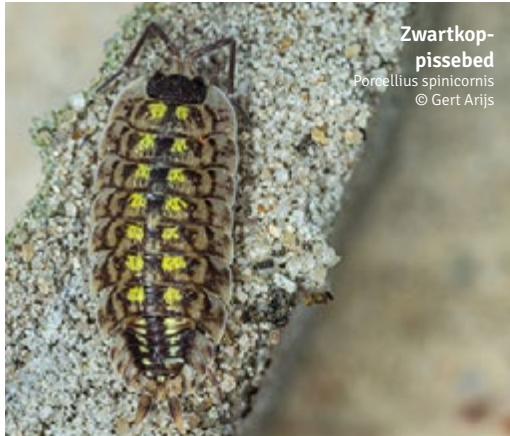
Zwartkop-pissebed Porcellio spinicornis

Elk dialect heeft er zijn eigen koosnaampje voor: keldermotten, varkskes, kelderzeugen of steenvarkens. Pissebedden zijn alomtegenwoordig, vervullen een belangrijke rol in onze ecosystemen en komen in elke Belgische tuin voor. Toch weten we er verdomd weinig van. Er is dus dringend nood aan nieuwe kennis over deze kreeftjes en daar wil de werkgroep Spinicornis de komende jaren aan werken. U doet toch mee?