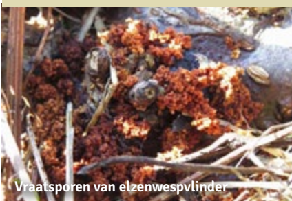
Vraatsporen van elzenwespvlinder

De voorbije twee jaar hebben we op Ter Pede flink de bijl gezet in de alomtegenwoordige elzenopslag om opnieuw een boomvrije plas- & draszone te creëren. Zo kan moerasvegetatie die overschaduwde raakte door de bomen terugkeren en krijgen we opnieuw waadvogeltjes, zoals witgatje en watersnip, op bezoek. Als kers op de taart zorgt de kapping ook nog voor een prima biotoop voor de elzenwespvlinder. Een zeldzame dagactieve nachtvlinder met doorzichtige vleugels waarvan de rupsen in elzenhout leven en nog wel het liefst... in het wondweefsel van gekapte bomen. Als je wil uitvissen of de elzenwespvlinder aanwezig is in je gebied dan kan je in mei-juni proberen ze te lokken met feromonen, geurstoffen die de vrouwtjes verspreiden om mannetjes aan te trekken. Helaas lukt dat niet zo goed bij deze soort bleek uit experimenten van Natuurpunt. Het is makkelijker, maar arbeidsintensiever, in de winter op zoek te gaan vraatsporen van de rupsen. Die vreten een gang uit vlak onder de schors, dicht bij de wortels. De houtpulp die hierbij ontstaat, wordt samen met de uitwerpselen in korrelvorm door een klein gaatje naar buiten gewerkt. Omdat elzenhout bruinrood kleurt na blootstelling aan de lucht, hebben deze korrels dezelfde kleur. Dus... op zoek naar rupsenpoep!