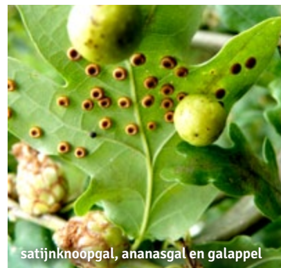
satijnknooppal, ananasgal en galappel

Bomen fascineren. Door hun omvang. Door hun levensduur. Door hun kracht om stabiele biotopen uit te bouwen. Op deze wandeling leren we niet alleen tal van boomsoorten onderscheiden aan de hand van hun knoppen, schors en vruchten, maar we maken ook kennis met hun bewoners, zoals gallen, paddenstoelen en mossen. En je krijgt antwoord op enkele prangende vragen: Waarom verliezen loofbomen hun bladeren? Hoe krijgen ze het nodige water opgepompt tot boven in hun kruin? Waarom moet je niet naar de bomen kijken om te zien met welk bos-type je te maken hebt? Niet te missen!